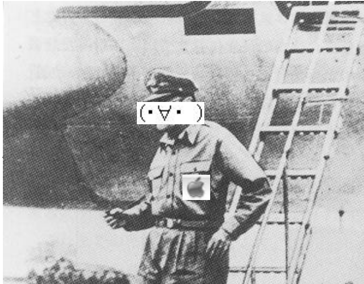
板に降り立つマカーさ元帥(厚木基地外にて)